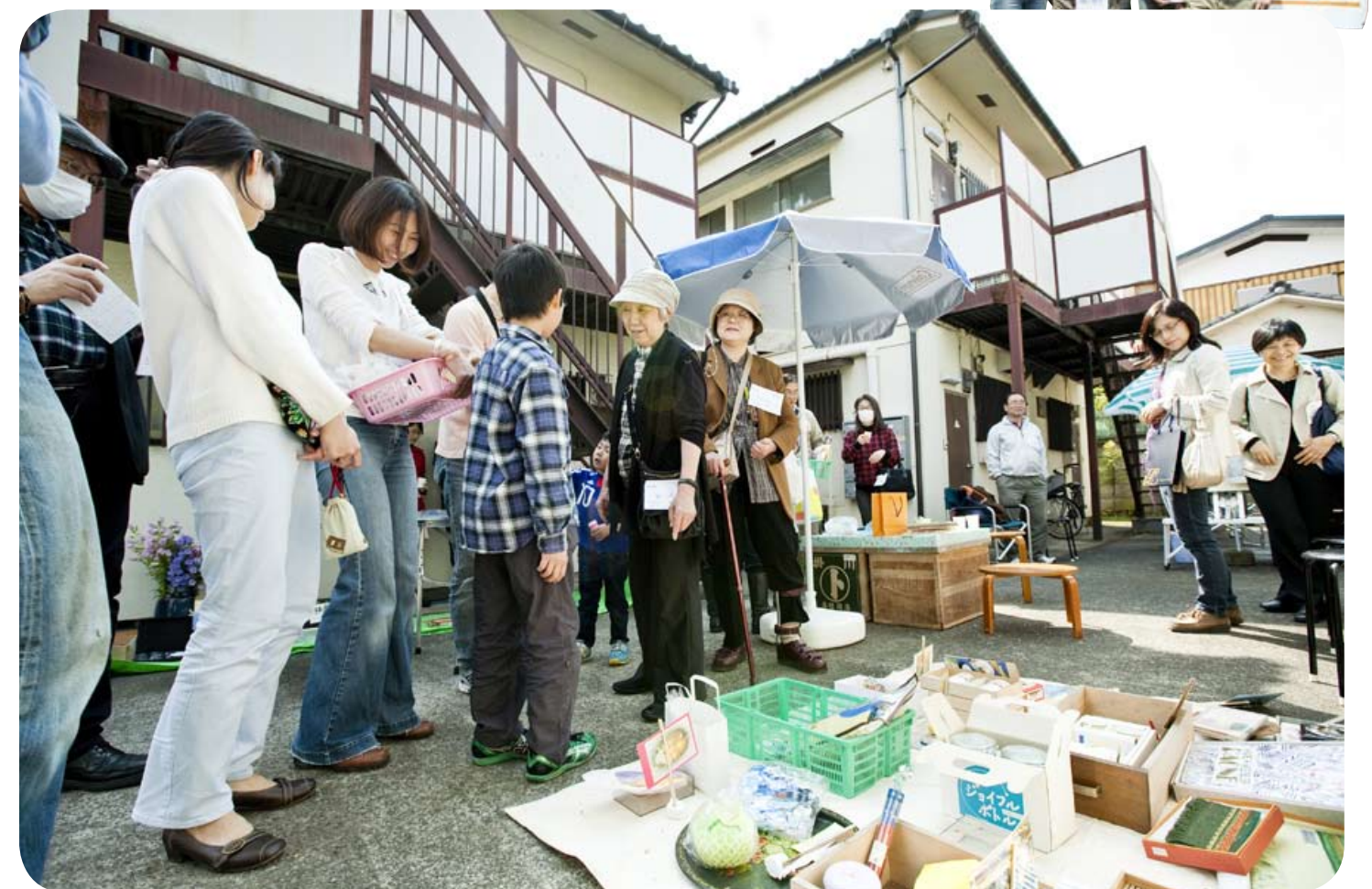
子どもからお年寄りまで不用品を持参し、わらしべ長者を目指した。フリーマーケットと違い、ゲームを楽しむような感覚。

かけ、自分の持ち物の中に相手が見たいものがあれば、物々交換が成立する。「どこの織物ですか」「どんな使い方をするんですか」と知らない者同士でも話しかけやすい。