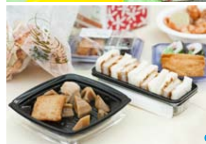
1 『わらしべ長者』の絵本。2 欲しいものを探す時間。3 折り紙の飾りと、アクリルたわしを交換。4 知らない人とも話がはずむ。5 クワガタの幼虫や小さい子どもに興味津々。6 食べものを差し入れてくれる人も。